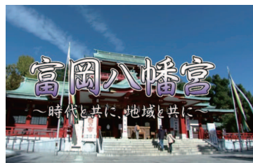
公式動画「時代と共に、地域と共に」

上記のSNSで八幡宮の最新情報を発信しています。 You Tube では公式案内動画「時代と共に、地域と共に」 「昭和43年本祭り」などを配信中。是非ご覧ください。