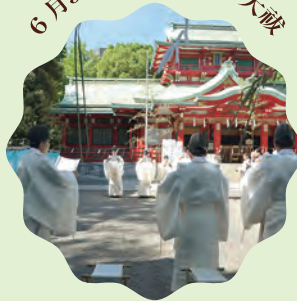
茅の輪をくぐって半年の罪穢れを祓います