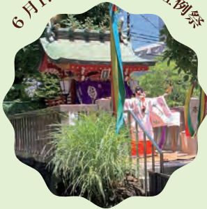
八幡さまの地主神、七渡神社の例祭です