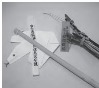
大蛇守は麦わらと和紙の二種類があります。(初穂料各千円)