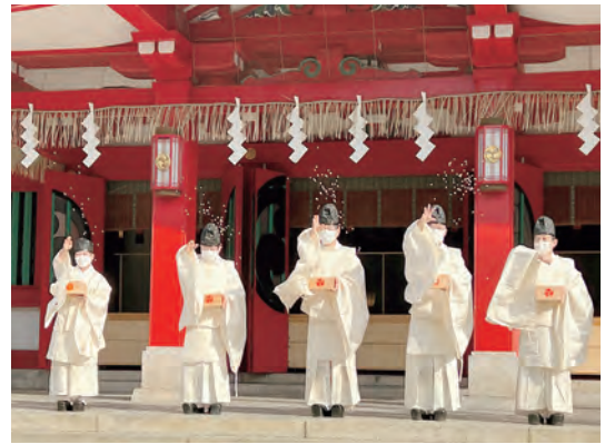
本年も宮司以下神職のみで御奉仕しました