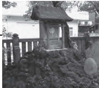
富士浅間神社の裏には小さな富士塚が。