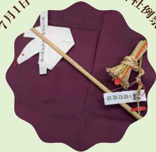
疫病除けの大蛇守が授与されます