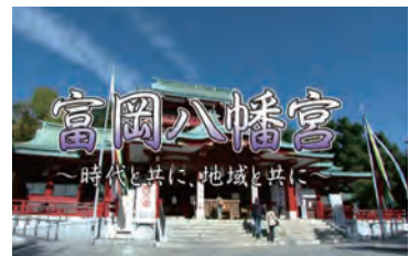
公式動画「時代と共に、地域と共に」

上記のSNSで八幡宮の最新情報を発信しています。You Tubeでは公式案内動画「時代と共に、地域と共に」「昭和43年本祭り」などを配信中。是非ご覧ください。