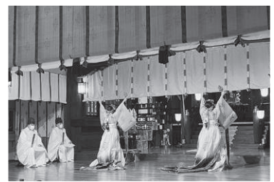
御神楽の儀 (13日・14日・15日)